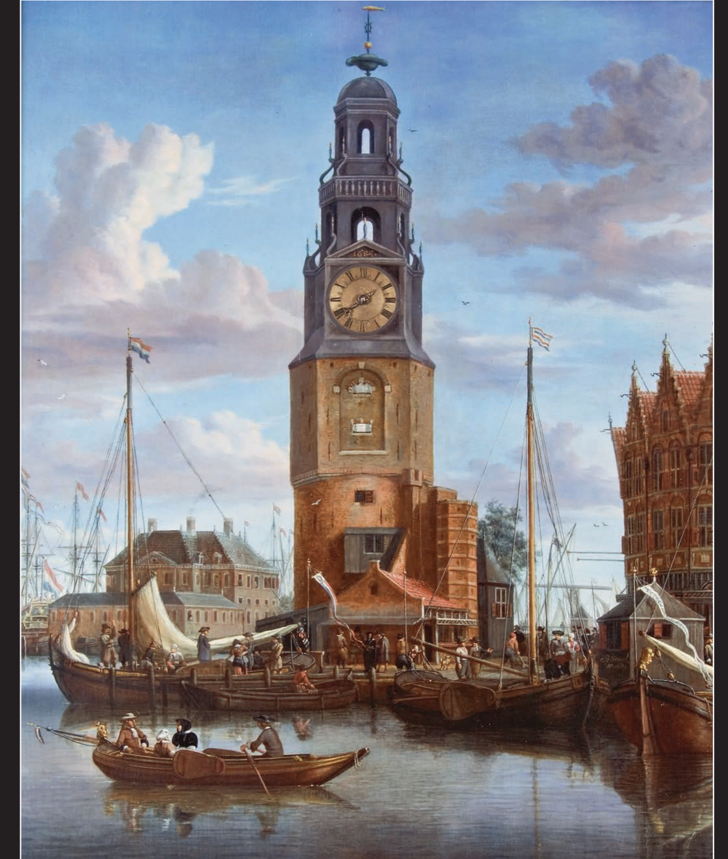
Dutch Old Master Marine Paintings, Drawings & Prints