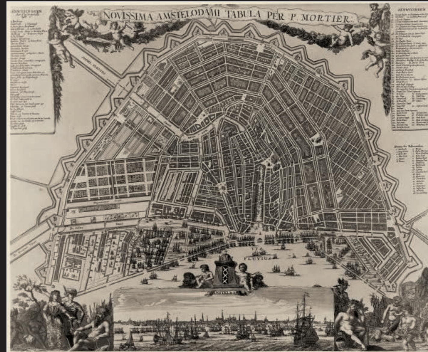
Novissima Amstelodami Tabula per P. Mortier Amsterdam 1692