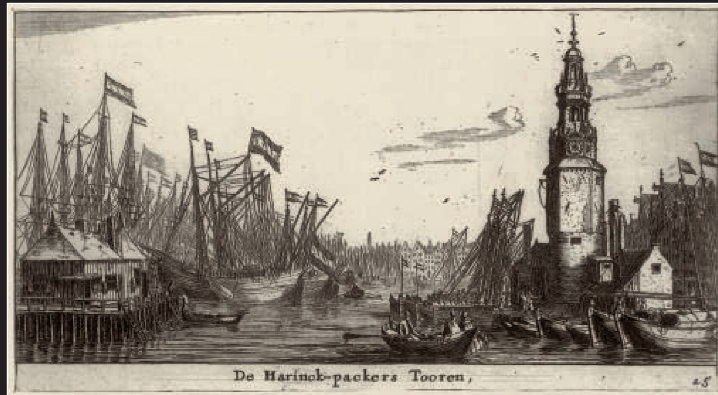
De Harinck-packers Tooren, Ets Reinier Nooms, alias Zeeman (Amsterdam 1623 of 1624 - 1664)