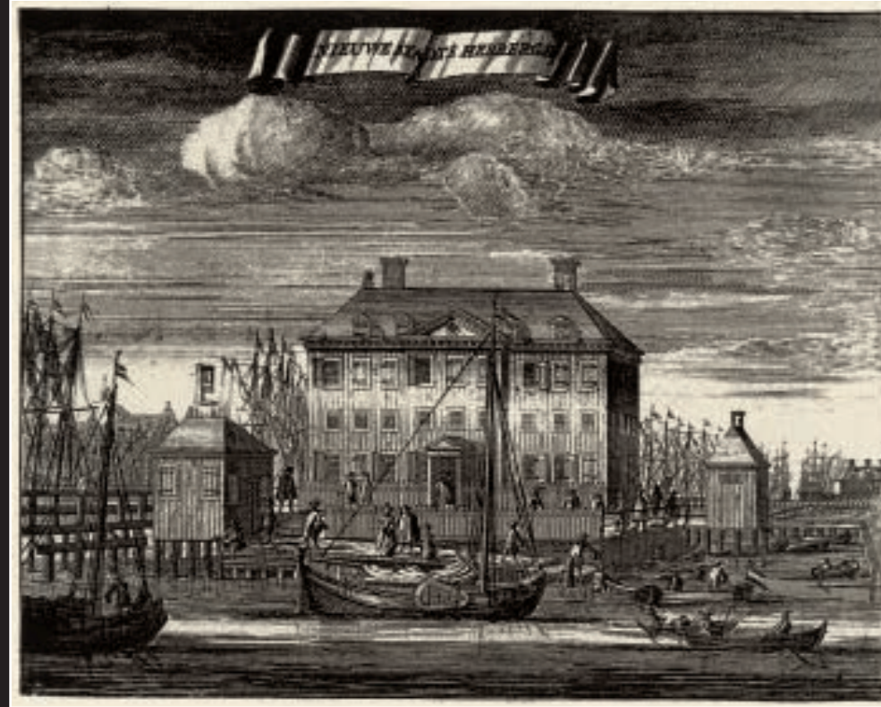
Gravure uit Casparus Commelin's beschrijving van Amsterdam, uitg. 1726