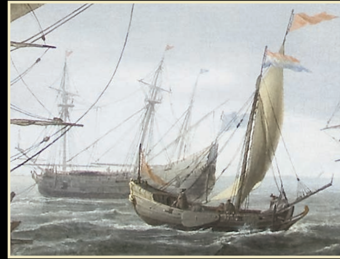
Een Jacht (in de voorgrond). Een verzamelwoord voor plezier en staatsvaartuigen. De grote jachten in de 17 e eeuw noemt men nu meestal statenjacht. Schepen in dienst van de Algemene of Provinciale Staten, de stadhouder, de compagnieën en de Admiraliteit.