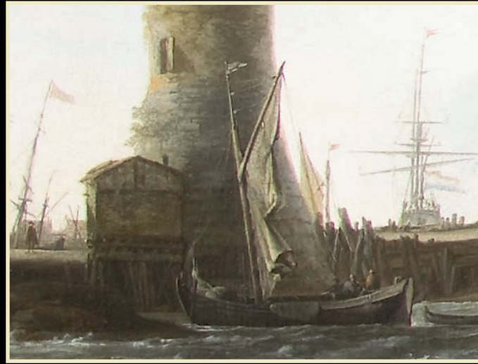
Een Wydschip. Voorzien van een staand gaffeltuig. Het wydschip is de grotere zuster van het smalschip. Zie ets Reinier Nooms, genaamd Zeeman, ca. 1623-1664 uit de serie (36 st) etsen. Verscheijde Schepen en Gesichten van Amstelredam, Naer t leven afgetekent en opt Cooper gebracht, door Reinier Nooms, al'as zeeman . Eerste deel A.11.