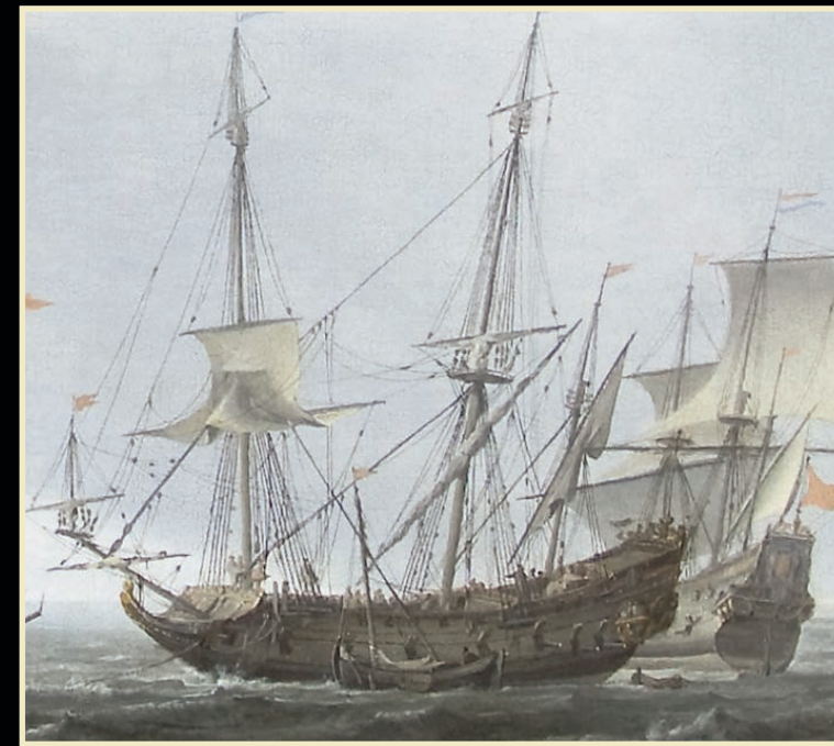
Een Fregat. Een licht wendbaar oorlogsschip. Fregatten in de 17e eeuw zijn oorlogsschepen die minder dan 40 stukken geschut voeren en die niet gebruikt worden als slagschip in de linie of de mêlée van het zeegevecht, maar als boodschapper, verkenner of transportschip. Zie ets Reinier Nooms, genaamd Zeeman, Verscheijde Schepen en Gesichten van Amstelredam, Naer t leven afgetekent en opt Cooper gebracht, door Reinier Nooms, al'as zeeman . Eerste deel A.3

Dutch Old Master Marine Paintings, Drawings & Prints