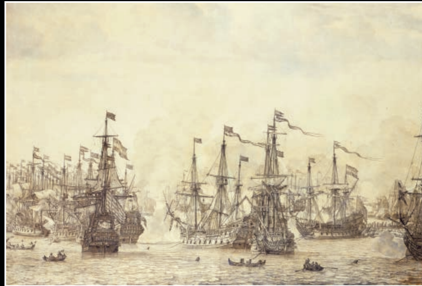
WILLEM VAN DE VELDE DE OUDE (Leiden 1611-1693 Londen) De mislukte aanslag van de Engelsen op VOC-vloot bij Bergen (Noorwegen), 12 augustus 1665