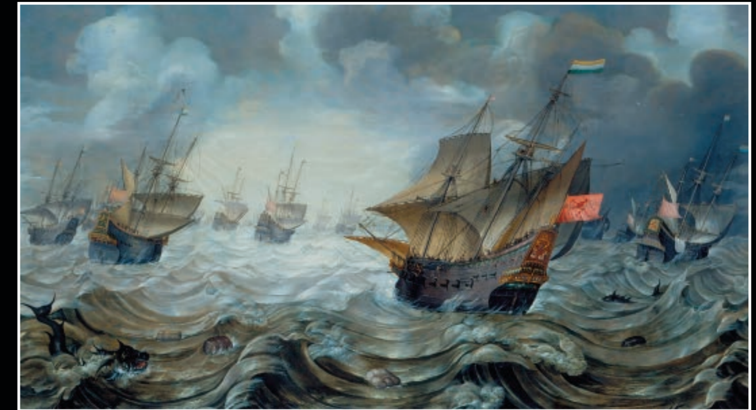
HANS SAVERY I (Kortrijk ca. 1564-na 1622 Haarlem) De oostindiëvaarder 'Amsterdam' en een groot aantal Amsterdamse oorlogsschepen op ze, ca. 1600

Het Scheepvaartmuseum De Vriendenvloot / VNHSM Antwoordnummer 10442 1000 RA Amsterdam