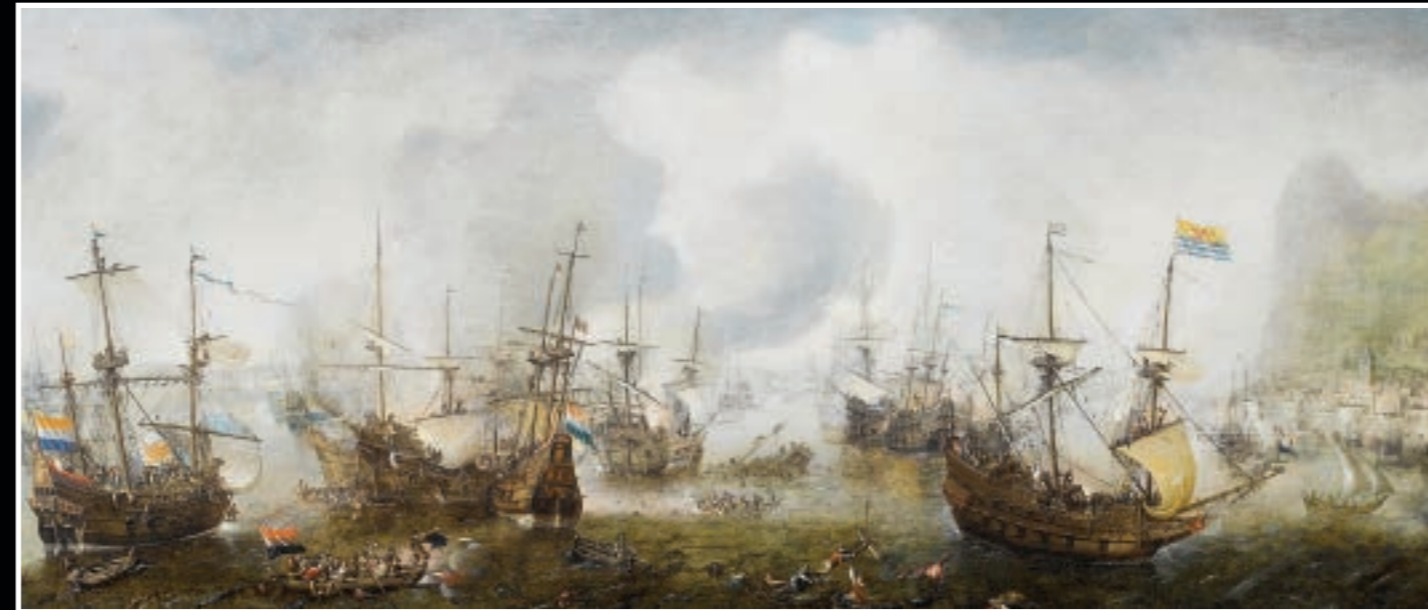
CORNELIS CLAESZ. VAN WIERINGEN (Haarlem ca. 1575-1633) Zeeslag bij Gibraltar, 25 april 1607