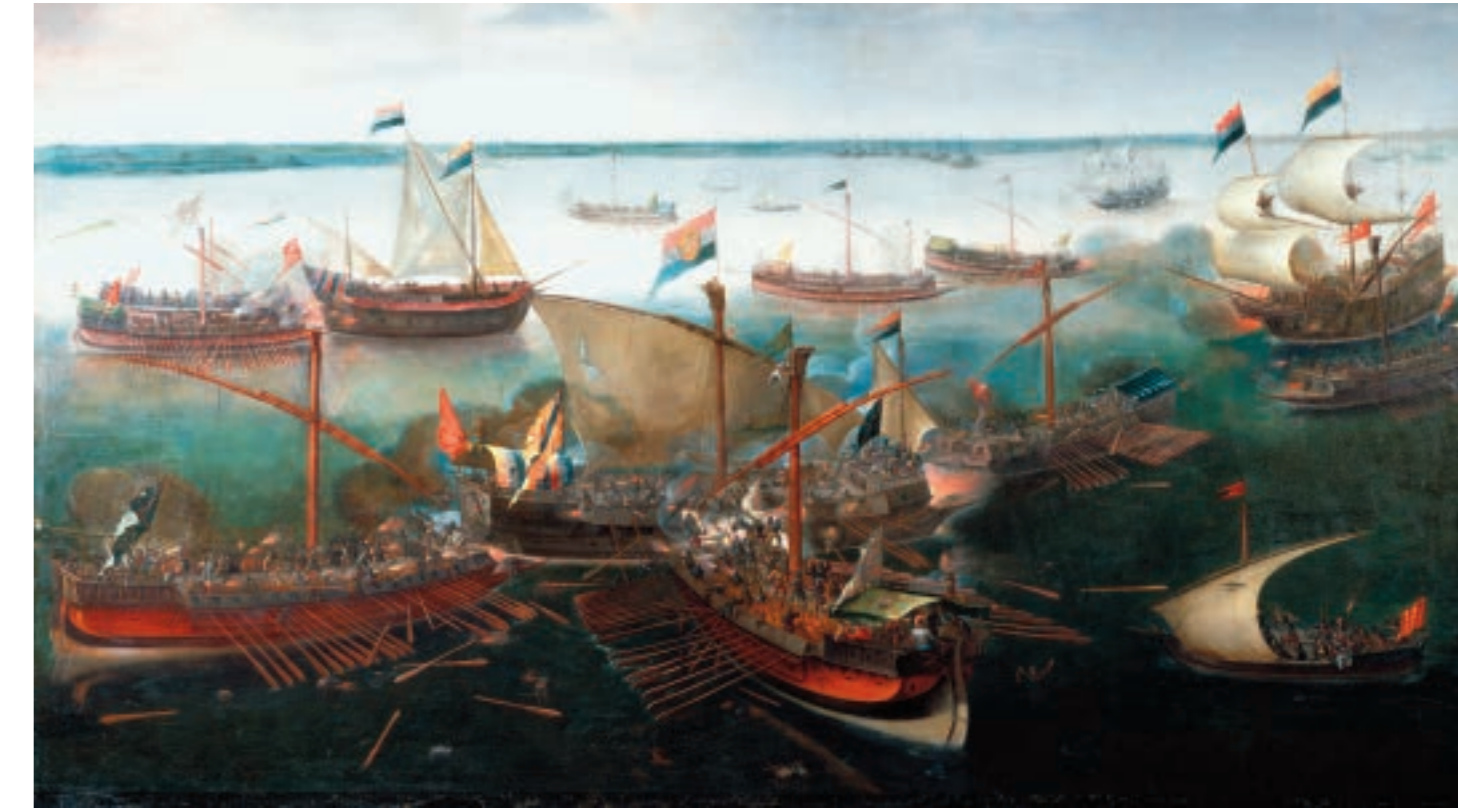
Verkocht als toegeschreven aan AERT ANTHONISZ. GENAAMD VAN ANTUM (Antwerpen 1580-1620 Amsterdam) De mislukte poging van Federico Spinola om de blokkade van Nederlandse schepen bij Sluis te doorbreken, 26 mei 1603