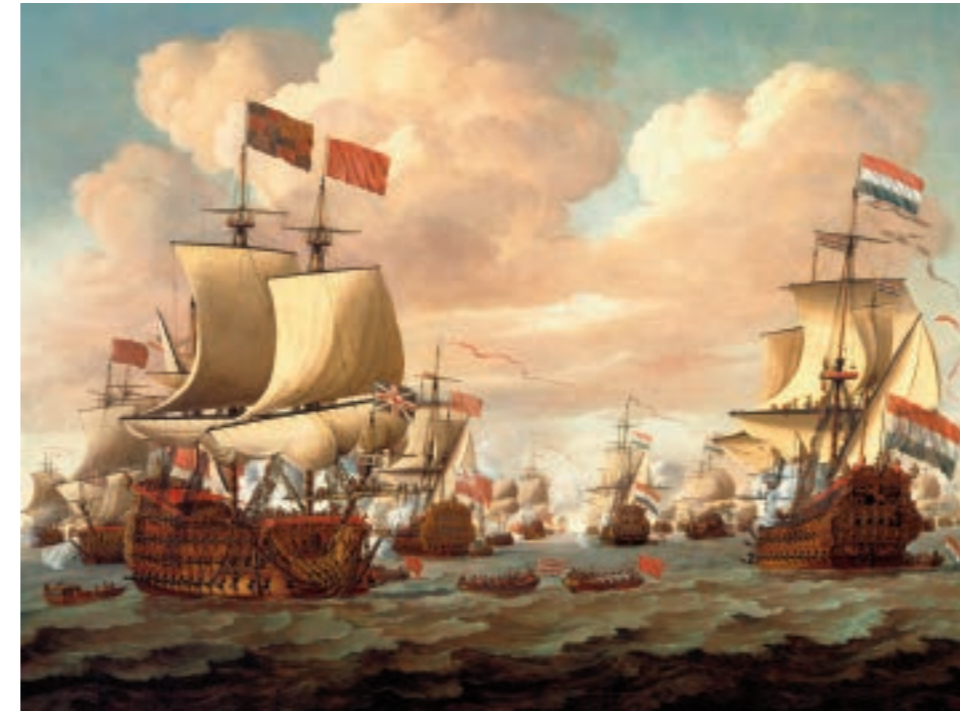
WILLEM VAN DE VELDE DE OUDE (Leiden 1611-1693 Londen) De 'Gouden Leeuw', de 'Gouda' en de 'Prince' omringd door andere schepen op zee