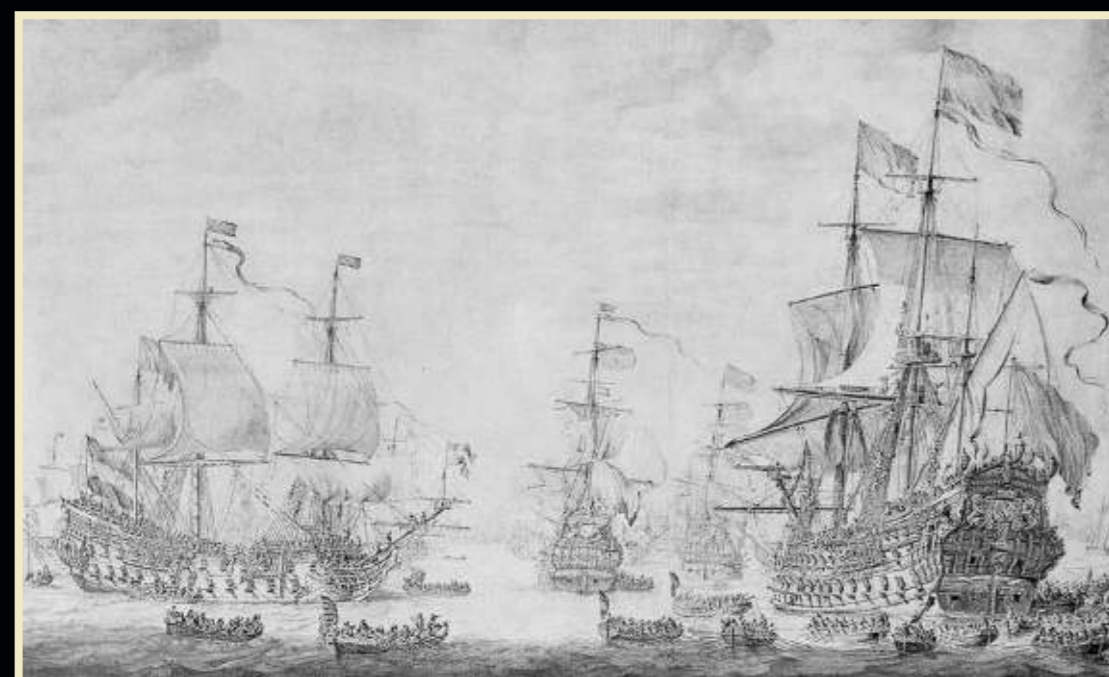
Krijgsraad aan boord van 'De Zeven Provinciën' voor de vierdaagse zeeslag. Penschilderij door Willem van de Velde de Oude. (Rijksmuseum Amsterdam).