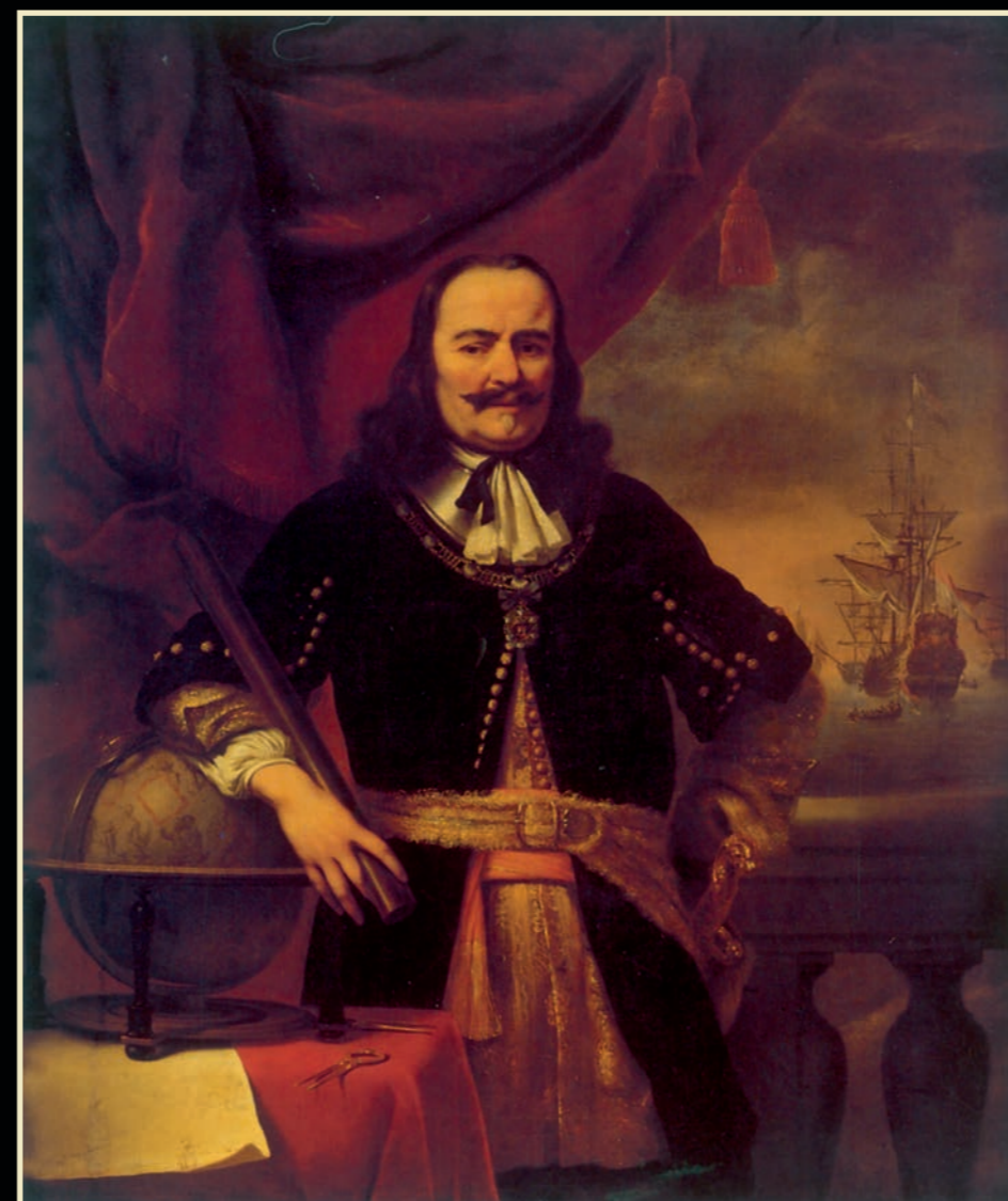
Portret van Michiel Adriaensz. de Ruyter (1607-1676) door Ferdinand Bol. (Nederlands Scheepvaart Museum Amsterdam).