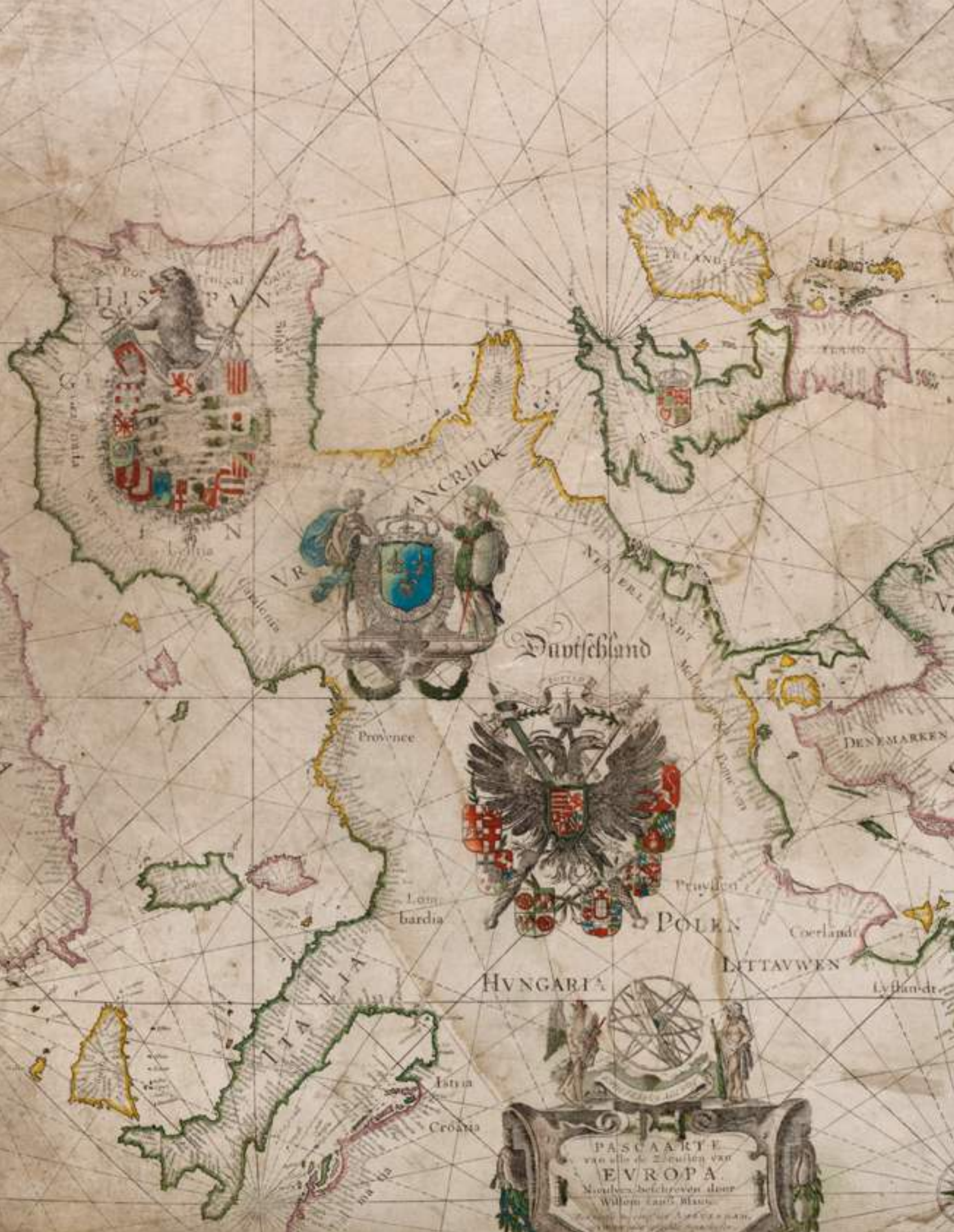
• Detail Willem Jansz Blaeu, 'Pascaarte van alle de Zeeusten van Evropa'. Gehele kaart op de volgende pagina.